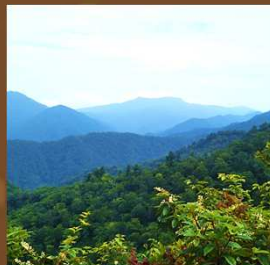
山形百名山登山 大自然を満喫! 「山の日」記念登山