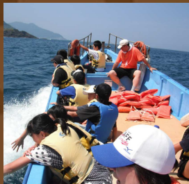
爽快!クルージング 海の魅力を全身で 感じてみよう!