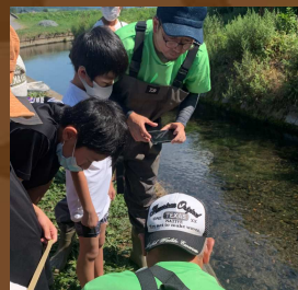
親子でSDGs 鳥海山の湧水めぐり 美しい景色が盛りだくさん