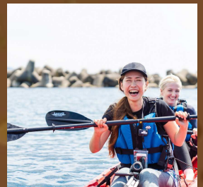
シーカヤック体験 日本海をめいっぱい 楽しもう!