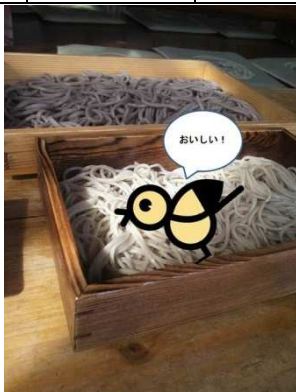
そば打ち体験をしてみたり・・・