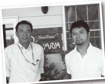
オーナー・シェフ

「ピザリア」では、隣接する畑でその日の朝に収穫した新鮮な野菜を使用しています。より美味しいものを提供するために、注文をうけてから作り始めます。日本人の味覚に合わせたという出来立てピザが絶品です! 素敵なテラスもあり、店内からもオーナーこだわりの山々や畑の風景が堪能できます。カウンター脇では1袋100円の旬の野菜も販売されています。バーベキューも行っており、季節に合わせて、さくらんぼ狩り、ラズベリー狩り、りんご狩りも楽しめますよ!